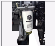
Sistema 3 etapas de filtración de combustible con separador de agua