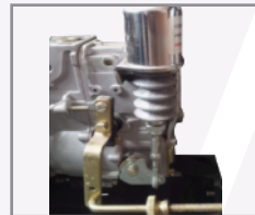
Sistema de protección 4 puntos