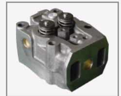
Cabezotes individuales con ángulo de inyección de baja inercia.