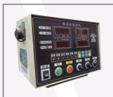
Panel de control digital con modo Local, Remoto y Autodiagnostico de seguridad