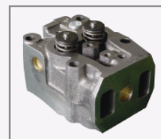
Cabezotes individuales con ángulo de inyección de baja inercia.