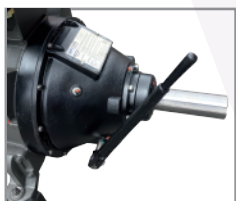
Embrague WPT SAE#3 tecnología sin rulimán piloto