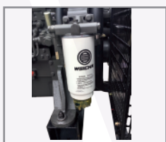
Sistema 3 etapas de filtración de combustible con separador de agua