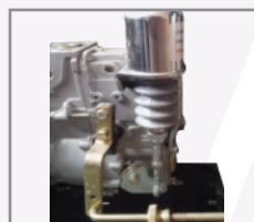
Sistema de protección 4 puntos