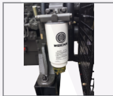
Sistema 3 etapas de filtración de combustible con separador de agua