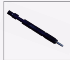
Inyector baja inercia