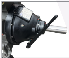
Embrague WPL314 sin ruliman piloto SAE#1 triple disco